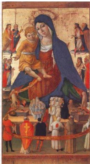
Tavola della Madonna del Monte. Lorenzo d'Alessandro. 1491 Caldarola